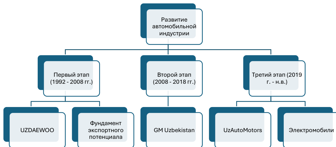
Рис.1. Этапы развития отрасли автомобилестроения

В первые годы после обретения Узбекистаном независимости в 1991 году в стране были созданы планы по созданию автомобильных заводов. В июне 1992 года Первый Президент Республики Узбекистан Ислам Абдуганиевич Каримов с официальным визитом в Южную Корею, осмотрел производство заводов «Daewoo», а в 1993 году Узбекистан заключил договор с корпорацией «Daewoo». В результате договорённости, в 1994 году было создано совместно с Daewoo UzAutoSanoat предприятие по автомобилестроению – «UzDaewooAuto». Производство началось в 1996 году после постройки завода в городе Асака в Андижанской области. Предприятие начало производство таких моделей, как Nexia, Damas, Tico и другие, этим самым была заложена основа экспортным возможностям. В 1996 году было создано «СамКочавто» предприятие совместно с турецкой компанией «Koç Holding», которое производило грузовые автомобили и автобусы. Позже, компания стала называться ООО «СамАвто».